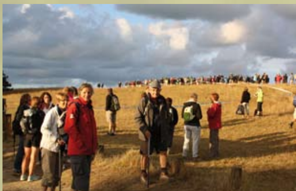
La randonnée des Deux Havres du 08/09/2013.

Un vrai succès pour cette exposition, initiée par l'Association des Amis de la Paroisse du Canton de Montmartin sur Mer, qui retraçait l'histoire de l'humanité, de l'origine à nos jours, en 10 scènes insolites. Les figurines étaient mises en scène dans un décor spécialement composé pour cette exposition par Bruno Lacroix, collectionneur de playmobil. Un jeu-concours a motivé tant les grands que les petits. Les gagnants de coffrets de jeux furent des amateurs de Cherbourg, Pirou, St Pair sur Mer et du Mesnil Aubert. 1750 visiteurs se sont pressés pendant les 4 jours précédant Noël. Des vidéos pour les enfants, un salon de thé, les Ateliers Créatifs de Lingreville et le marché de Noël paroissial ont complété l'animation de cette rencontre inédite et familiale dans la salle Normandy.