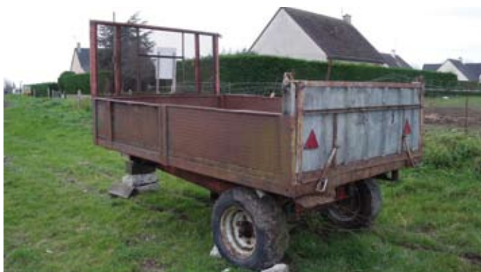
Epave remorque avec ridelles

La commune met en vente le matériel ci-joint en photo au plus offrant, à savoir :