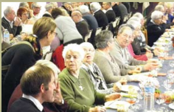
Repas des Cheveux Blancs du 24/11/2013.