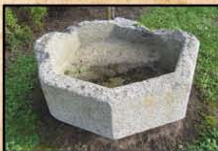
Châsse de St Gaud.