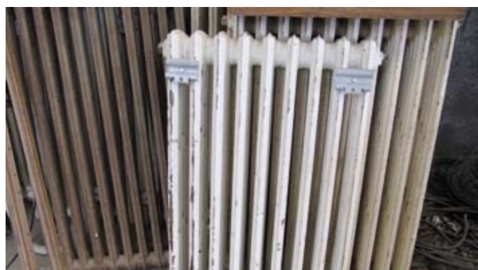
Radiateurs en fonte

Une visite du matériel peut être envisagée sur rendez-vous. Les offres seront à remettre sous enveloppe en mairie pour le 10 Mars à 12h00 dernier délai.