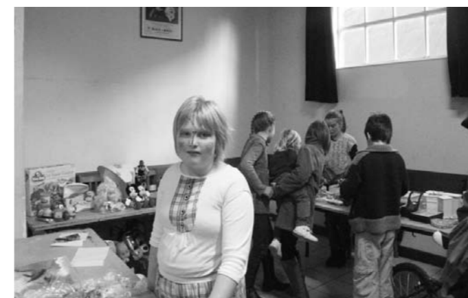
Bourse aux jouets et maquillage des enfants

Cette association de commerçants et d'artisans créée depuis 1998 organise des manifestations (loto en début d'année, le marché de Noël, quinzaine commerciale et le concert de Noël en décembre).