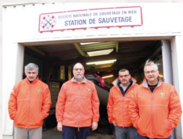
Les 4 piliers de la Société Nationale de Sauvetage en Mer de Hauteville que nous vous présenterons dans notre prochain bulletin.