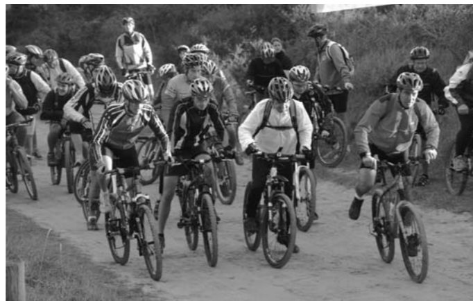
Nouveauté 2010: randonnée des 2 Havres en VTT