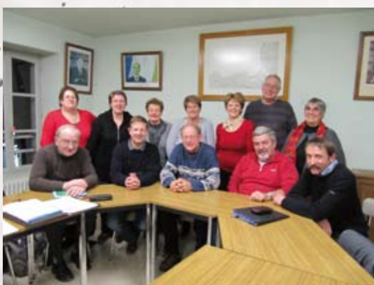
Conseil municipal du vendredi 07 janvier 2011

Conformément à ce que je vous annonçais dans le bulletin de juillet, ce sixième numéro est en grande partie consacré aux « Services » et en particulier aux services à la personne dans notre commune.