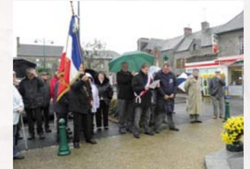
Cérémonie du 11 novembre