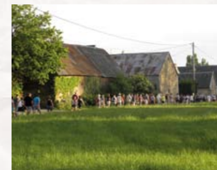
8 juillet : rando coucher de soleil rue H. Garnier.