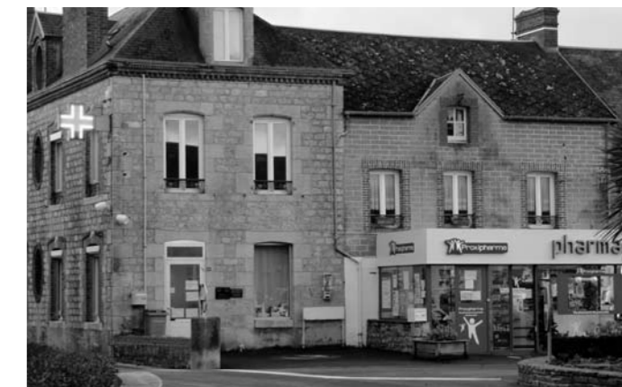
Côte à côte, les infirmières, la podologue et la pharmacie

A Lingreville nous espérons garder très longtemps notre pharmacie qui porte bien son nom d'enseigne : proxipharma.