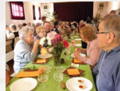
10 octobre : Le repas des anciens à la salle Normandy