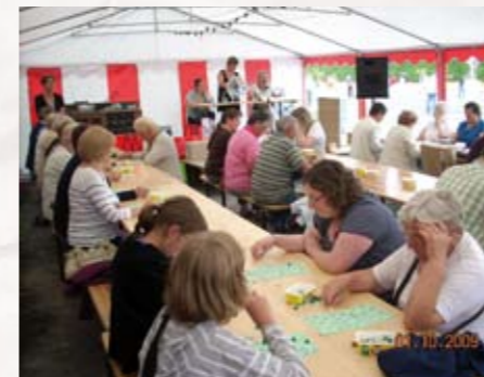
Fête St Martin: le loto