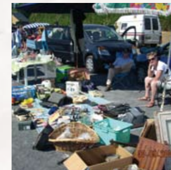
Fête St Martin: le vide grenier