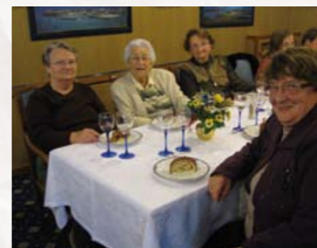
Repas du Club de l'Amitié de Lingreville, «aux 13 assiettes»